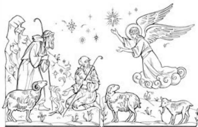
Aujourd'hui, dans la ville de Bethléem, vous est né un Sauveur qui est le Christ, le Seigneur. Luc 1, 11