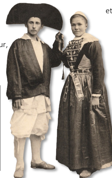
Mariés de Saillé en 1910

Bons parents de Nazareth, faites de notre paroisse Sainte-Anne une communauté brûlante de charité. AMEN.