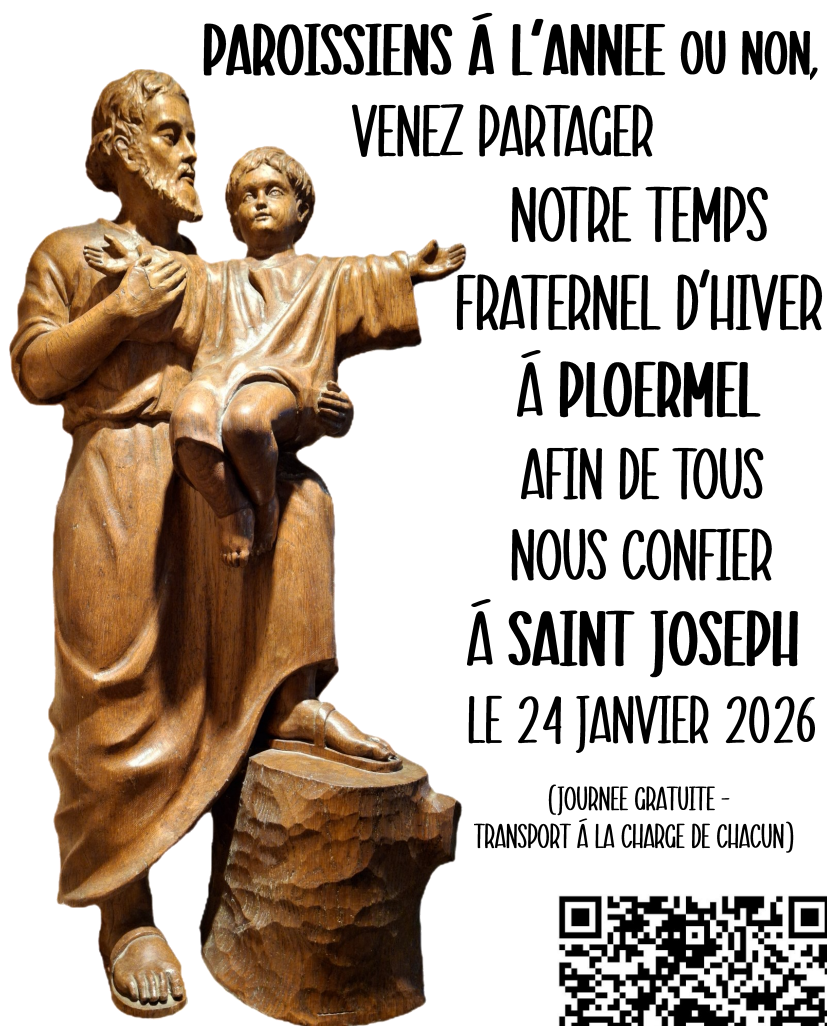
Photo du saint Joseph des frères de Ploërmel

PAROISSIENS À L'ANNEE OU NON, VENEZ PARTAGER NOTRE TEMPS FRATERNEL D'HIVER À PLOERMEL AFIN DE TOUS NOUS CONFIER À SAINT JOSEPH LE 24 JANVIER 2026