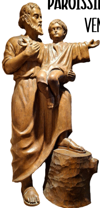
Photo du saint Joseph des frères de Ploërmel

PAROISSIENS À L'ANNEE OU NON, VENEZ PARTAGER NOTRE TEMPS FRATERNEL D'HIVER À PLOERMEL AFIN DE TOUS NOUS CONFIER À SAINT JOSEPH LE 24 JANVIER 2026